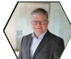
Uwe Gaudig Griesemann Engineering GmbH